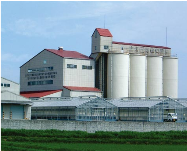
脱穀した籾を貯蔵する大型の施設だ。しっかりと乾燥させた後に、低温で保存をするよ。